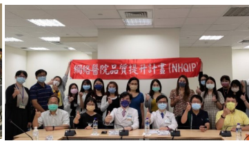
NHQIP 群組與醫院夥伴大合照