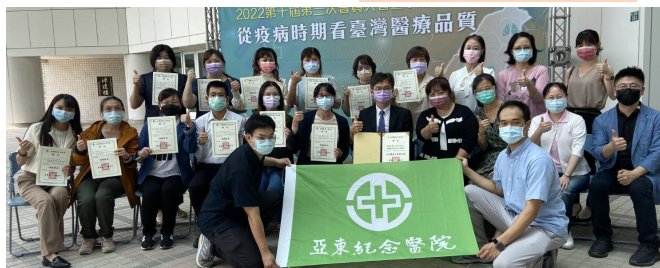
入選口頭及海報發表同仁與院長合影