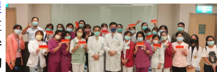
參賽團隊成員與評審委員合影

第22期品管圈暨專案改善期中登錄審查活動於08月19日舉辦，共13組團隊進行發表， 透過院內專業評審的指導與建議，提供團隊後續修正 ，在此感謝各團隊積極參與，為品質改善活動共同努力。