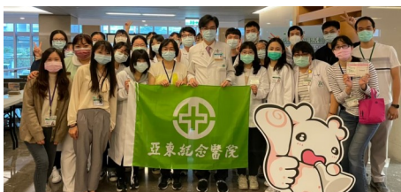
闖關活動工作人員大合照

為宣導醫療團隊與病人及家屬間建立良好合作夥伴關係的概念，分別於 10 月 14 日及 17 日舉辦闖關活動及兒童著色活動，宣導就醫提問單、採檢、用藥、孕產兒等安全概念，並透過著色活動，由基礎扎根，提升民眾參與病安之意願，期能促使民眾踴躍響應及主動參與病人安全工作。