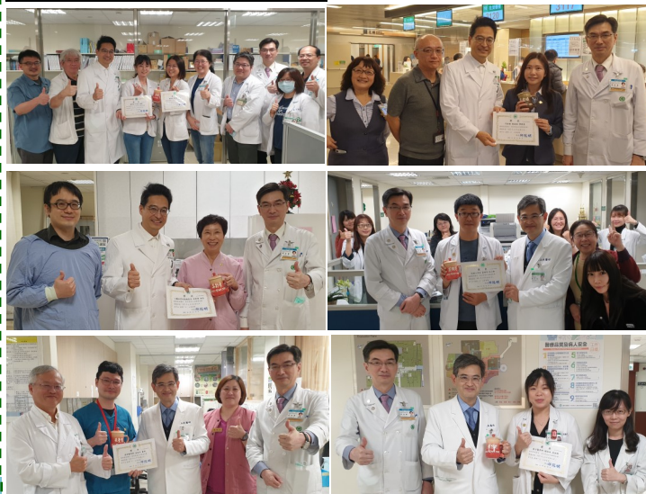
副院長及單位主管至現場表揚優秀的一線同仁