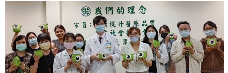
學員完成作品大合照