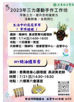
手作工作坊7月課程海報