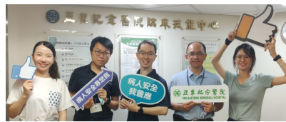
高擬真急診醫學部講師

為促進團隊合作(TRM)及病人安全，急診醫學部、護理部、品質管理中心、臨床技能中心，共同推動高擬真教育訓練，06/07 完成第一梯次教育訓練，後續將在08/16、09/13 及 10/13 登場，讓醫療團隊在實際操作流程中，體驗學習處理病人的臨床技能、醫療團隊合作與溝通技巧。