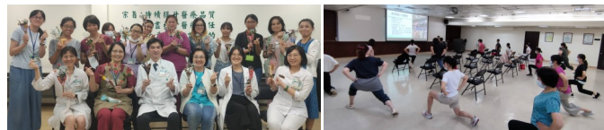
學員完成樹枝編織作品大合照