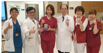
彭副院長及單位主管至現場表揚優秀的一線同仁