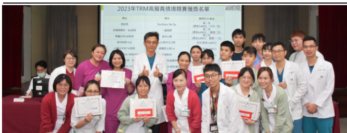
院長與獲獎團隊大合照