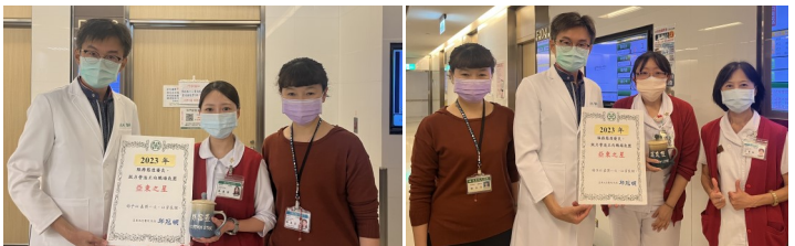
院長及單位主管至現場表揚優秀的一線同仁