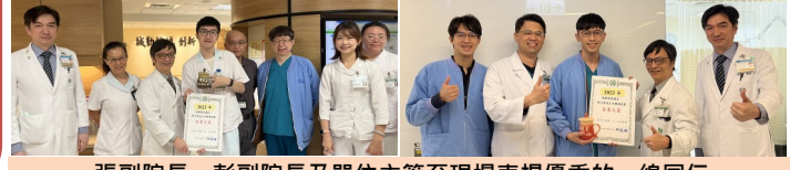
張副院長、彭副院長及單位主管至現場表揚優秀的一線同仁