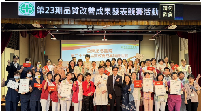
評審與參與團隊同仁合影