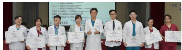
恭喜眾多科部獲得 SDM 新人獎

為鼓勵各科部積極參與「醫病共享決策 (SDM) 推動」，於 2024 年 7 月 16 日院務會議表揚執行成效優良科部，本次由耳鼻喉科暨頭頸外科、放射腫瘤科、急診醫學部、重症醫學部(2 項主題)、神經醫學部、胸腔內科(4 項主題)、胸腔外科、復健科獲得新人獎；另由放射腫瘤科、泌尿科、神經外科、神經醫學部(3 項主題)、胸腔內科(3 項主題)、麻醉部、腎臟內科、新陳代謝科榮獲績優獎，共 13 個科部 24 項主題接受表揚，恭喜獲獎單位，也邀請各科部持續參與。