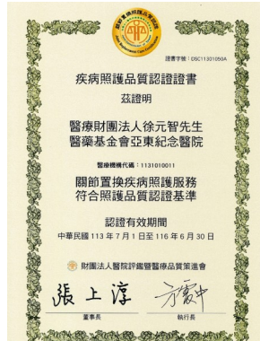
關節置換認證證書