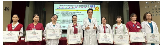
恭喜眾多科部獲得 SDM 績優獎