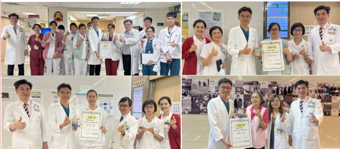
院長及單位主管至現場表揚優秀的一線同仁